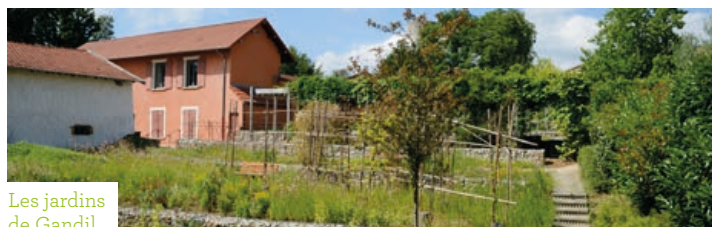
Les jardins de Gandil

À l'origine, le parc désignait la zone de territoire enclos appartenant à un château. La révolution industrielle lui a donné une nouvelle signification, celle de superficie préservée dans le but de favoriser un sentiment de nature dans les grandes villes. Au XX e siècle, la conception paysagère du parc s'est enrichie d'autres usages, comme le chemin de promenade.