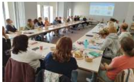
Réunion partenaires C.I.D.E. du 22 septembre

Pour sensibiliser et échanger sur le sujet, un programme d'exposition, conférence, temps fort ouvert à toutes les familles, projection de film et spectacles au Neutrino sont programmés du 14 novembre au 1er décembre pour petits et grands, en famille.