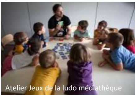
Atelier Jeux de la ludo médiathèque