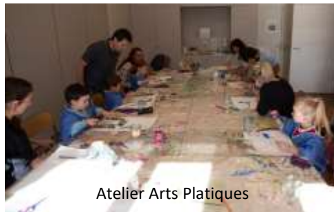
Atelier Arts Platiques

Pour la rentrée du Passeport découvertes 4-6 ans et 7-10 ans, les ateliers étaient ouverts aux parents pour découvrir les activités et rencontrer les animateurs.