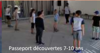
Passeport découvertes 7-10 ans

Jusqu'à l'événement final du 11 juin, des ateliers Bal Funk de danse et un atelier de confection de décors ont été organisés à la Maison. Avec des interventions aux Moussaillons et Jeunesse, au Passeport découvertes, en ateliers libres, autant d'occasions de rencontres entre les générations.