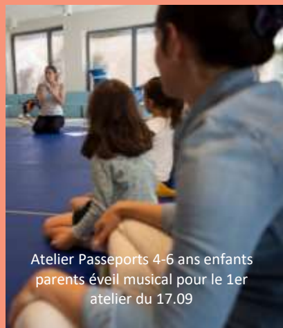
Atelier Passeports 4-6 ans enfants parents éveil musical pour le 1er atelier du 17.09

Inscription sur l'espace famille, à la MdTG, au Guichet Unique.