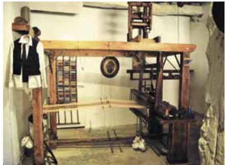
Le métier à tisser