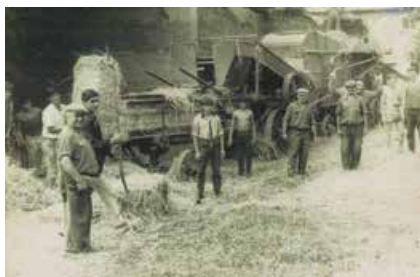
Le battage en 1968