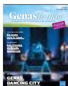
Photo de couverture : le futur spectacle Abba Génération, programmé le 6 décembre à Genas.