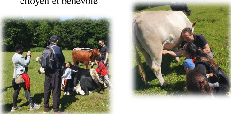
Des échappées familiales en pleine nature...

Des actions fortes de soutien et d'accompagnement à la parentalité avec le passport intergénérationnel , les échappées familiales , les conférences thématiques des grands rendez-vous , l' escale famille , les ateliers spécifiques (cf. : le 1 er téléphone portable de mon ado )