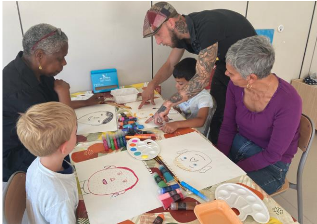
12 juin 2024 : Atelier de peinture intergénérationnel sur les portraits : enfants des Moussaillons/Seniors