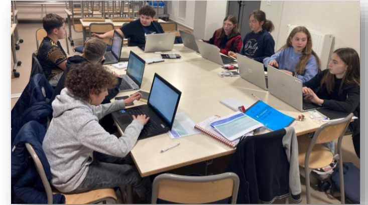
2023/2024 : Commission du mardi du CMJ