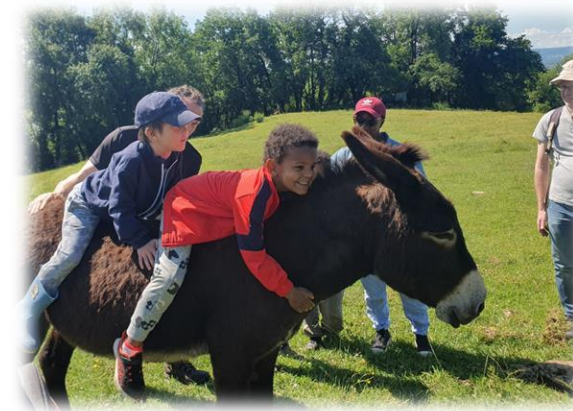
Moment de détente avec les échappées familiales – Promenade en âne dans le Vercors...