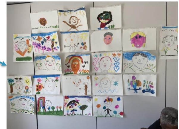
12 juin 2024 : les portraits des seniors réalisés par les enfants des Moussaillons

+ Actions passerelle Crèches/Moussaillons/Ifac