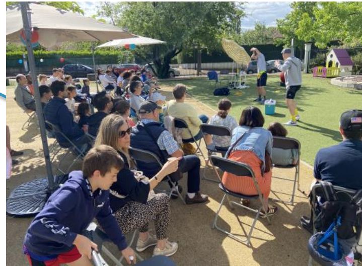
15 juin 2024 : pot de clôture des passeports découvertes 2023/2024. Au menu : petit déjeuner et activités de danse et de cirque !