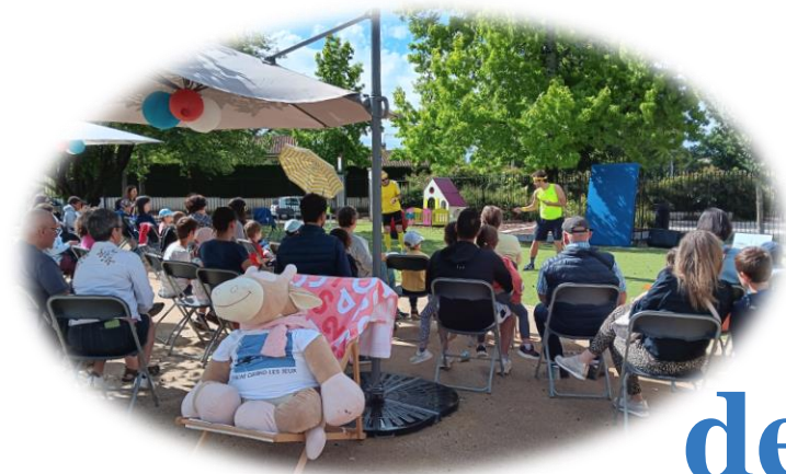
La sens de la fête de La Maison...