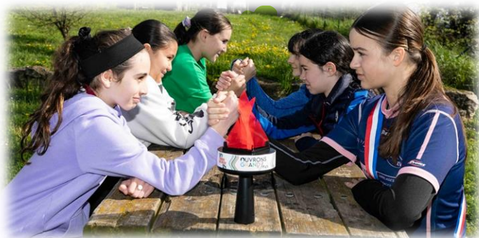
La force et l'énergie de la jeunesse...