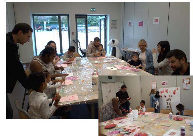
Un passport intergénérationnel plébiscité par les familles

Nouveau : plateforme participative de mode de garde : « entraidons-nous entre Genassiens »